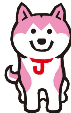
ジャック (JKCマスコットキャラクター)